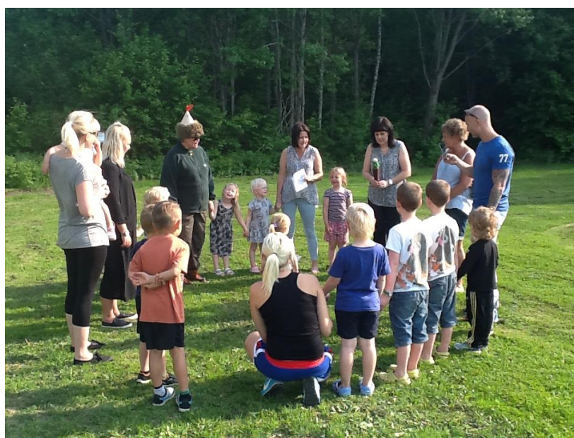
Avslutning på våra friluftsskolor, Mulle – Knytte - Knopp