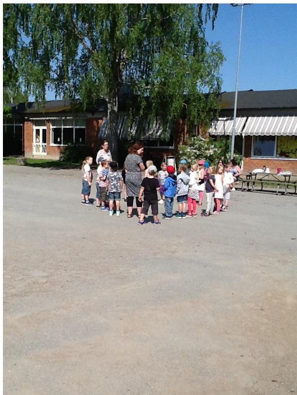
Besök på Aggerudsskolan.